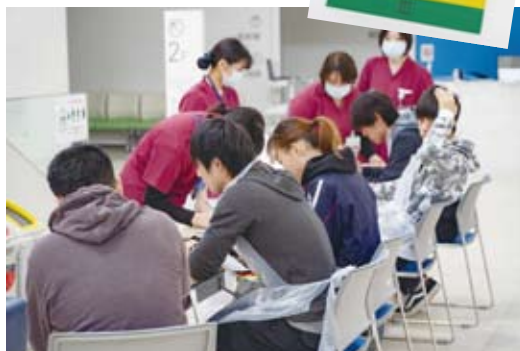
トリアージエリア内、軽症者の問診・処置