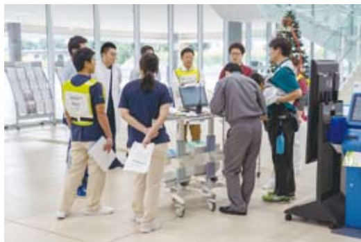
トリアージエリア設置の現場ミーティング

建物の損壊が発生するような大規模災害の場合、カルテや薬歴などの患者情報が失われる可能性があります。そんな時にお薬手帳は患者さんの状況把握、適切な医療と医薬品の提供に有用な情報源となります。避難の際には忘れずに持ち出すようにしてください。