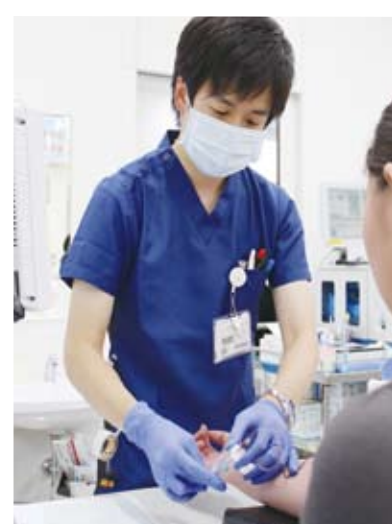
採血の様子。検査室は明るく開放的です。