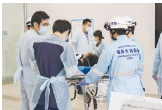
救急隊が搬送してくる負傷者受入れの様子