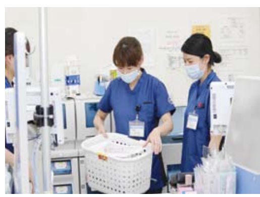
病棟での採血のための器具を準備しています。