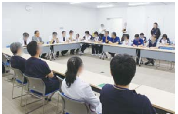
定例の全体ミーティング