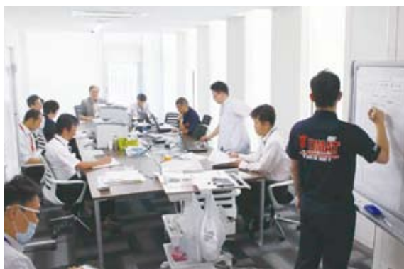
院内災害対策本部(発足時)