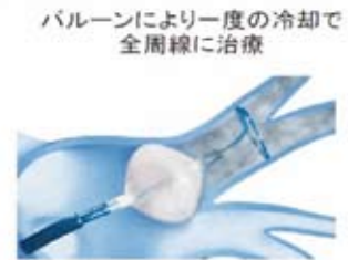
クライオバルーンアブレーション