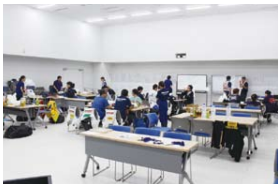
病院支援指揮所と、派遣されたDMAT